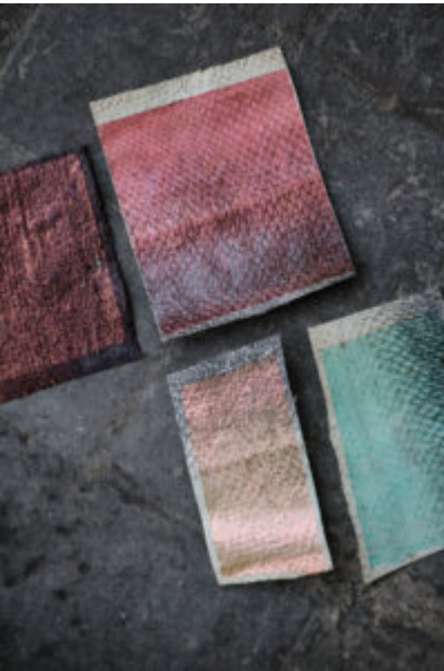
® Elodie Timmermans