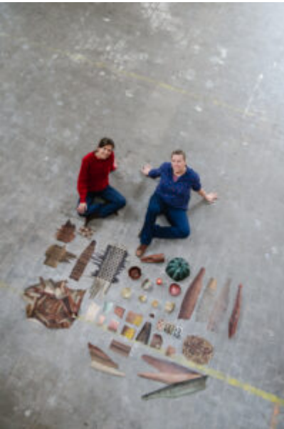
® Elodie Timmermans