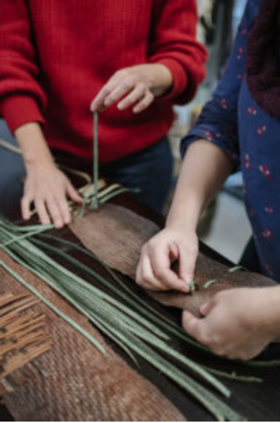
® Elodie Timmermans