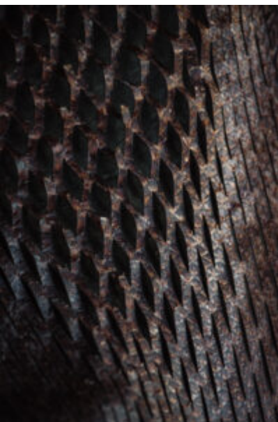
® Elodie Timmermans