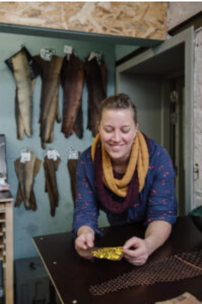
® Elodie Timmermans