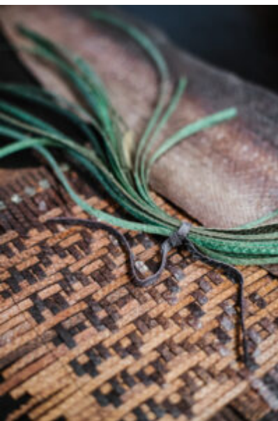
® Elodie Timmermans