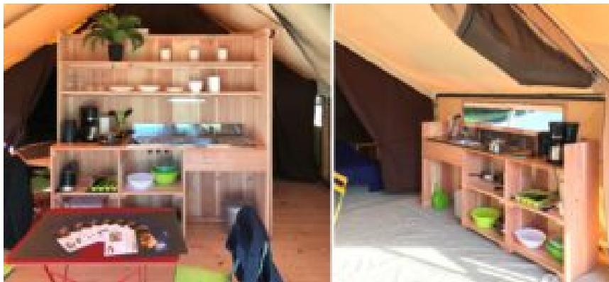
Mobilier de la tente Crusoe

Son travail permet de donner forme au projet, de le rendre concret au travers de visuels. Cela demande une phase d'analyse qui aboutit à la composition d'un cahier des charges au départ des éléments recueillis. S'ensuit une phase créative qui amène la designer à proposer des solutions dans différentes directions. Cabanon peut alors poser des choix, de façon plus sûre, et définir leur souhait pour le projet.