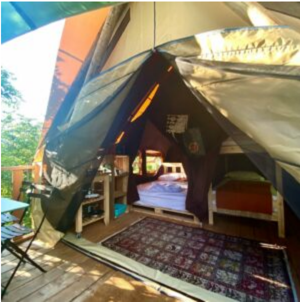
La tente Robinson

contribuer à développer les plus pertinentes.