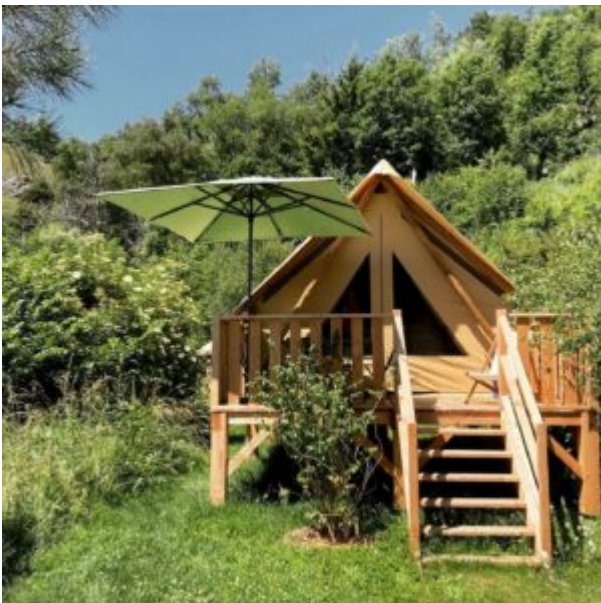
La tente Robinson