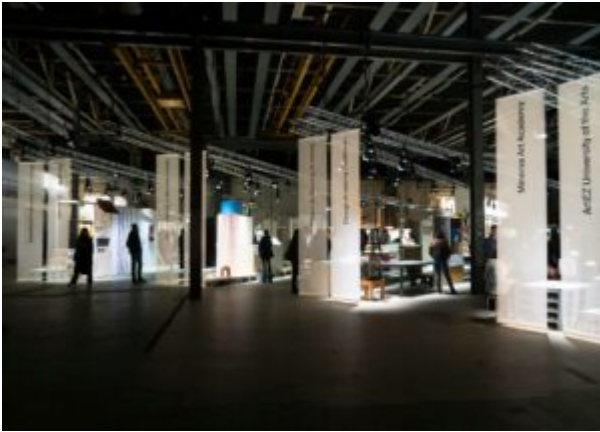
Class 21