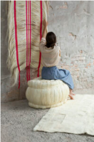
Unravelling the Coffee Bag – Rosana Escobar