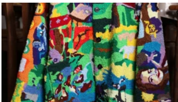
Community Couture

Le rapport aux objets est questionné notamment au niveau de la valeur qui leur est consacrée . Celle-ci se base sur différents types d'interactions avec l'objet, pouvant être de l'ordre de