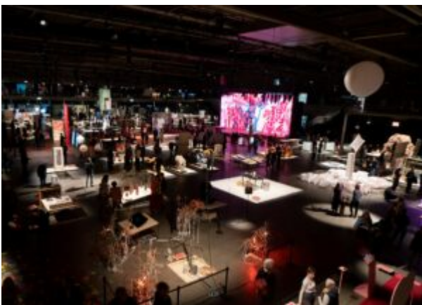
Graduation Show

Avec son projet Unravelling the Coffee Bag , Rosana Escobar déconstruit les sacs de grains de café pour revenir au matériau de base, le fique, plante colombienne, qu'elle tente de détacher du marché duquel il dépend ( en savoir plus ). Ginevra Petrozzi propose quant à elle de questionner les données traitées par les réseaux sociaux, données trop aisément par leurs utilisateur·trice·s : dans Digital Esoterism , elle propose d'entrer en interaction avec le visiteur, et plus particulièrement avec les contenus sponsorisés d'un réseau social, pour en faire une lecture divinatoire. Une approche originale qui permet néanmoins une réflexion sur notre comportement numérique ( en savoir plus ).