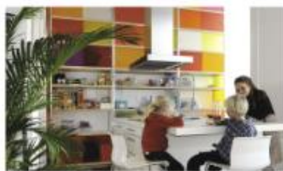
DANS LA CUISINE