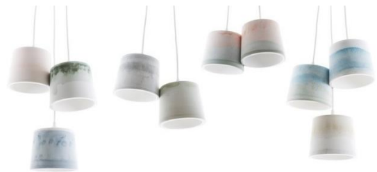
Rainbow Shade Stock Range