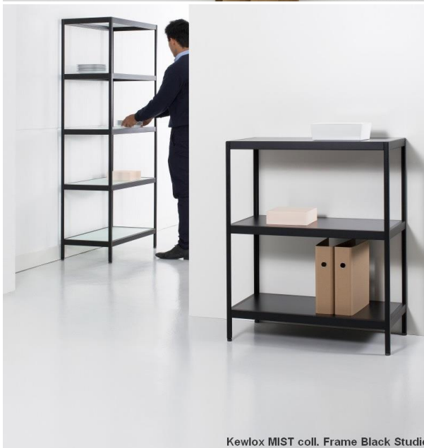
Kewlox MIST coll. Frame Black Studio