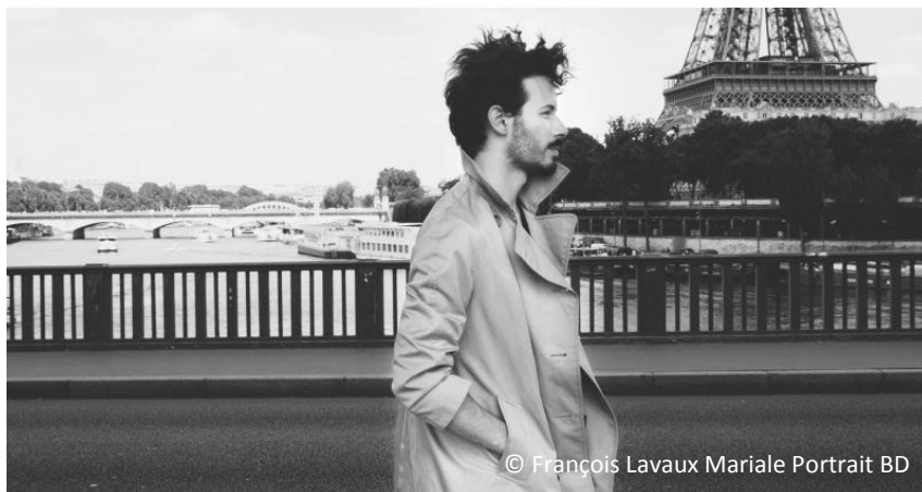
© François Lavaux Mariale Portrait BD