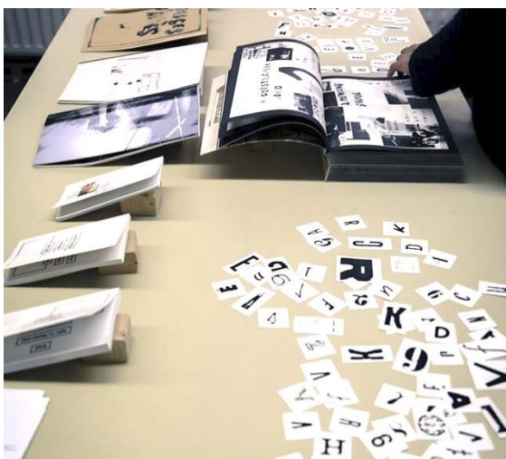
Fig. 2 e édition: 2,3,4 février 2018. Liège.

Vous avez des remarques sur la 1 ère édition ou des suggestions pour les prochaines, dites-le aux organisateurs.